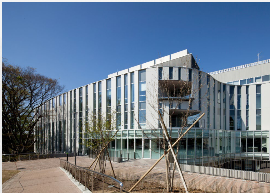
瀬谷区総合庁舎外観